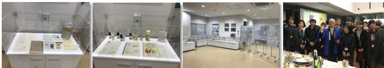
抗生物質研究室で単離された化合物の展示物（左）と、理研百周年交流会での展示スペースと、懇親会での記念写真（右）