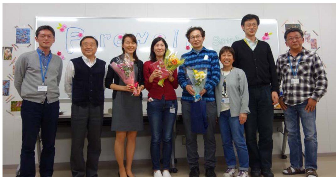
3月23日の送別会にて